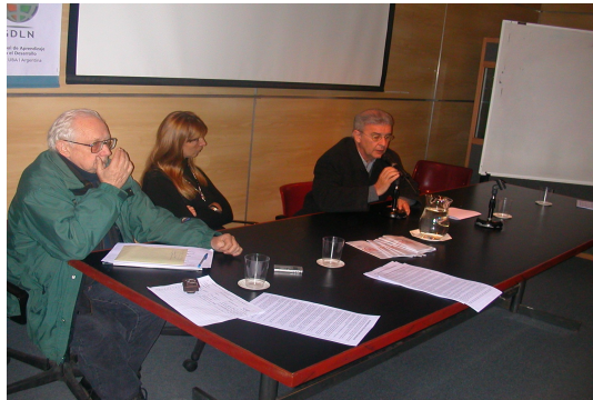
Jornada Red Hábitat - FADU: Facultad de Arquitectura Bs. As. (Junio 2008)