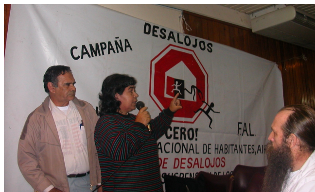
Jornada Red Hábitat: Tierra y Agua, Universidad de Posadas, Misiones