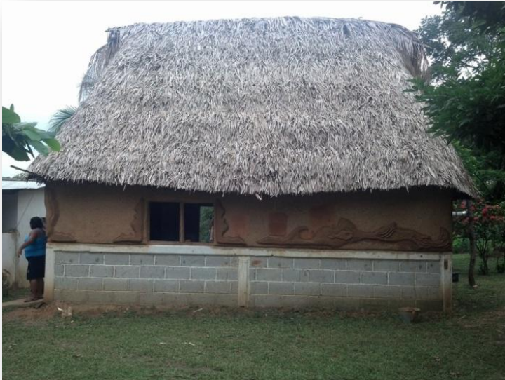
Bajareque y Tapapecho ó embarre –Tierra cruda