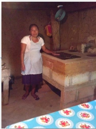
Estufas ahorradoras de leña